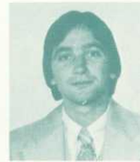
Kim Hamilton Secondary School Teaching Certificate San Francisco State Univ.