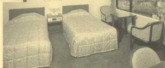
客室 (ツインルーム)