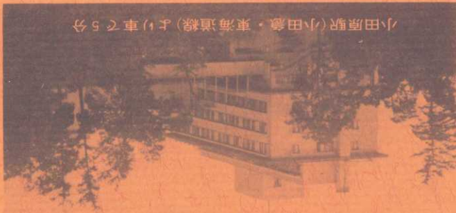
小田原駅(小田原・東海道線)より車で5分

アジアセンターは箱根山を背に相模湾に面した高台の景 勝の地にあり、地下2階地上5階の近代的な建物にはL.T. 教室、図書室、大ホールのほか、海外生活と同じ雰囲気 の宿泊設備、食堂、談話室も完備しています。