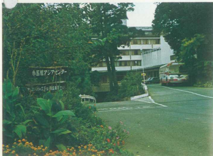
アジアセンターの入口