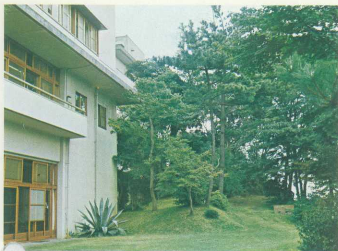
庭園と木立のセンター