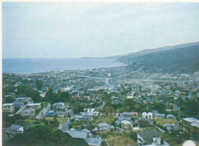
アジアセンターから眺望