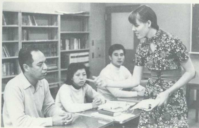
小人数制の授業風景