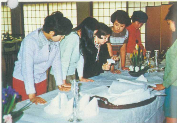
フォーマルデナーパーティーの授業風景

◎週末には真鶴、伊豆、大島、箱根、富士五湖、清水等に外人スタッフとL I O Jのバスで旅行等の特別プログラムがあります。