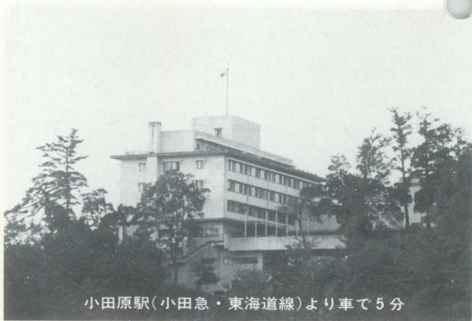
小田原駅(小田急・東海道線)より車で5分