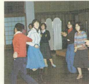
特別プログラム スポーツ大会、ダンスパーティ、スライド、ショー等を企画、授業のあい間も楽しく過ごしていただきます。