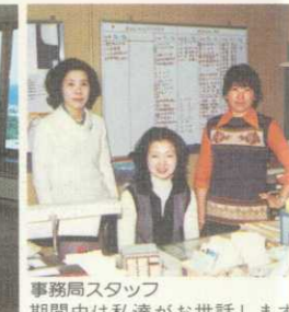
事務局スタッフ 期間中は私達がお世話しませう。どんなことでも英語でお申し付けください。