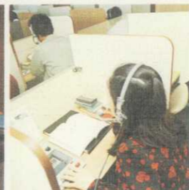
L.L. 授業 (自習時間には生徒に装置を開放します。)