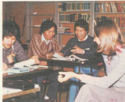
初日にプレイズメントテストを行い能力別クラスを編成して、あなたの実力に合わせた適切な学習指導を行います。