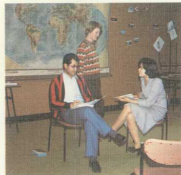
G.I.S. あなたの目的に合わせて、ユニークな個人及びグループ指導を行います。