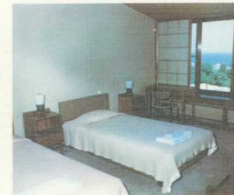
寝室は洋室、バス・トイレ付 3-5人の集団生活スタイルです。