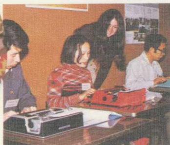
選択科目のタイピングクラス授業風景