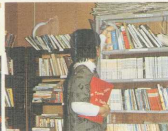
豊富な図書や資料がそろっています。必要な先生の許可を得てご利用になれます。