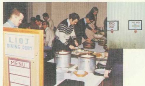
食事は先生と一緒に、家庭的な雰囲気の中で。