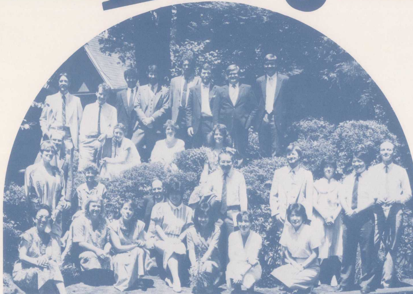
各コース共、定員になり次第締切らせて頂きますのでお問い合わせはお早目に!