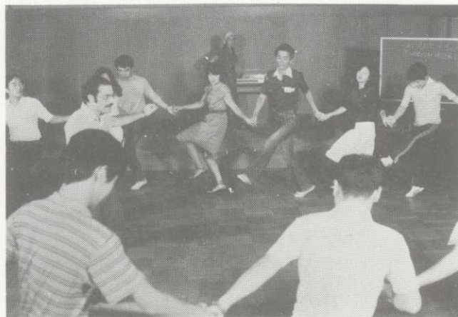
スペシャルプログラム

土曜日の午前中は、スポーツ大会などクラスレベルに関係ない特別なプログラムが企画されています。参加は自由ですが、講師との人間的な理解を深め合う上で大変良い機会となりますので、受講者は積極的に参加されるようお薦めします。