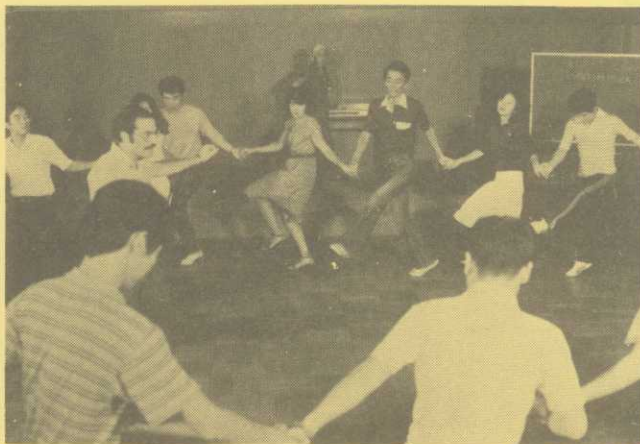
スペシャルプログラム

土曜日の午前中は、スポーツ大会などクラスレベルに関係ない特別なプログラムが企画されています。参加は自由ですが、講師との人間的な理解を深め合う上で大変良い機会となりますので、受講者は積極的に参加されるようおめします。