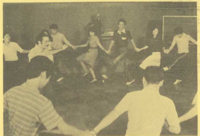
スペシャルプログラム

土曜日の午前中は、スポーツ大会などクラスレベルに関係ない特別なプログラムが企画されています。参加は自由ですが、講師との人間的な理解を深め合う上で大変良い機会となりますので、受講者は積極的に参加されるようおすすめします。