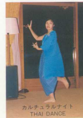
カルチュラルナイト THAI DANCE

LIOJはそうした受講者の自主活動が120%充実したものとなるよう期待いたします。