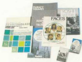
LIOJで開発されたテキスト