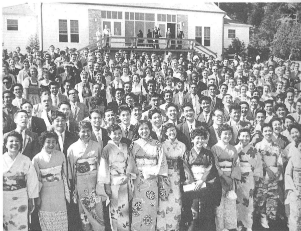
ナエンジした明るい顔、顔、顔