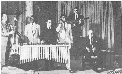
その日の出来事をその国の言葉で通訳歌にする日本人の楽団