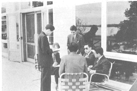
食事の組合せは大変な仕事です