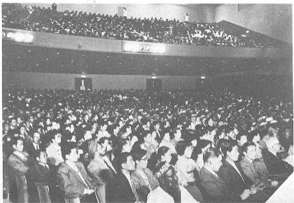
アトロイト、フォード記念劇場における全米黒人地位向上大会に 迎えられた日本代表