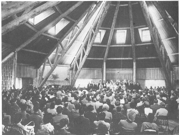
最も特徴のある本遊大集会場においてM・R・Aコーラスが歌ふ日本の歌