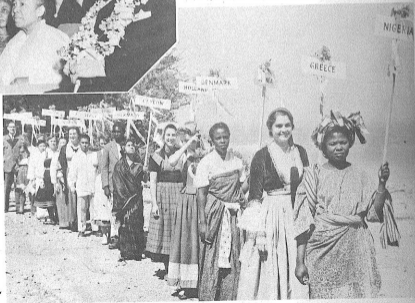
マキノ島に於ける ライラック祭に参加したM・R・Aの各団代表