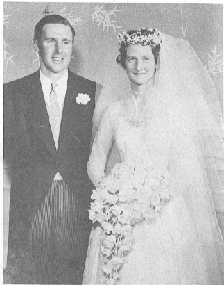
世界の代表達の心からの祝福を受けてマキノで結婚した二人。判郎、ブライマン・アーバインはかつて日本にも無敵全勝した輝かしいオックスフォード大学ラグビーチームの花形。判郎はリョットはイギリス有数の名門