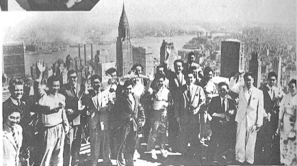
ニューヨーク市ロックフェラーセンター七十階屋上にて背後に国旗 (左) クライスタービル (中央) を望む