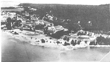
マキノ島M・R・Aセンターの全景