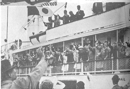
乗船旅行に出る日本代表