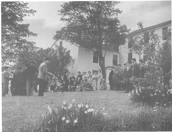
宿舎前の新しい芝生に趣き代表たち